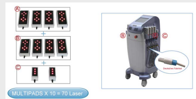
Lipolaser FG 660H-001 Multipads (Behandlungsplatten)